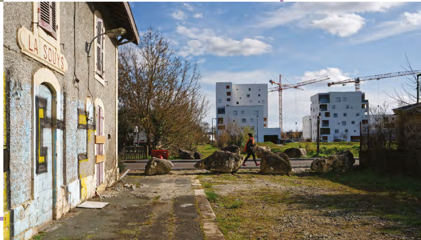
Regards sur la métropole par Vincent Monthiers - Quartiers en mutation - ZAC de Floirac depuis l'ancienne voie ferrée Bordeaux-Eymet

Retrouvez les séries Regards sur la métropole par nos photographes sur bordeaux-metropole.fr/Regards