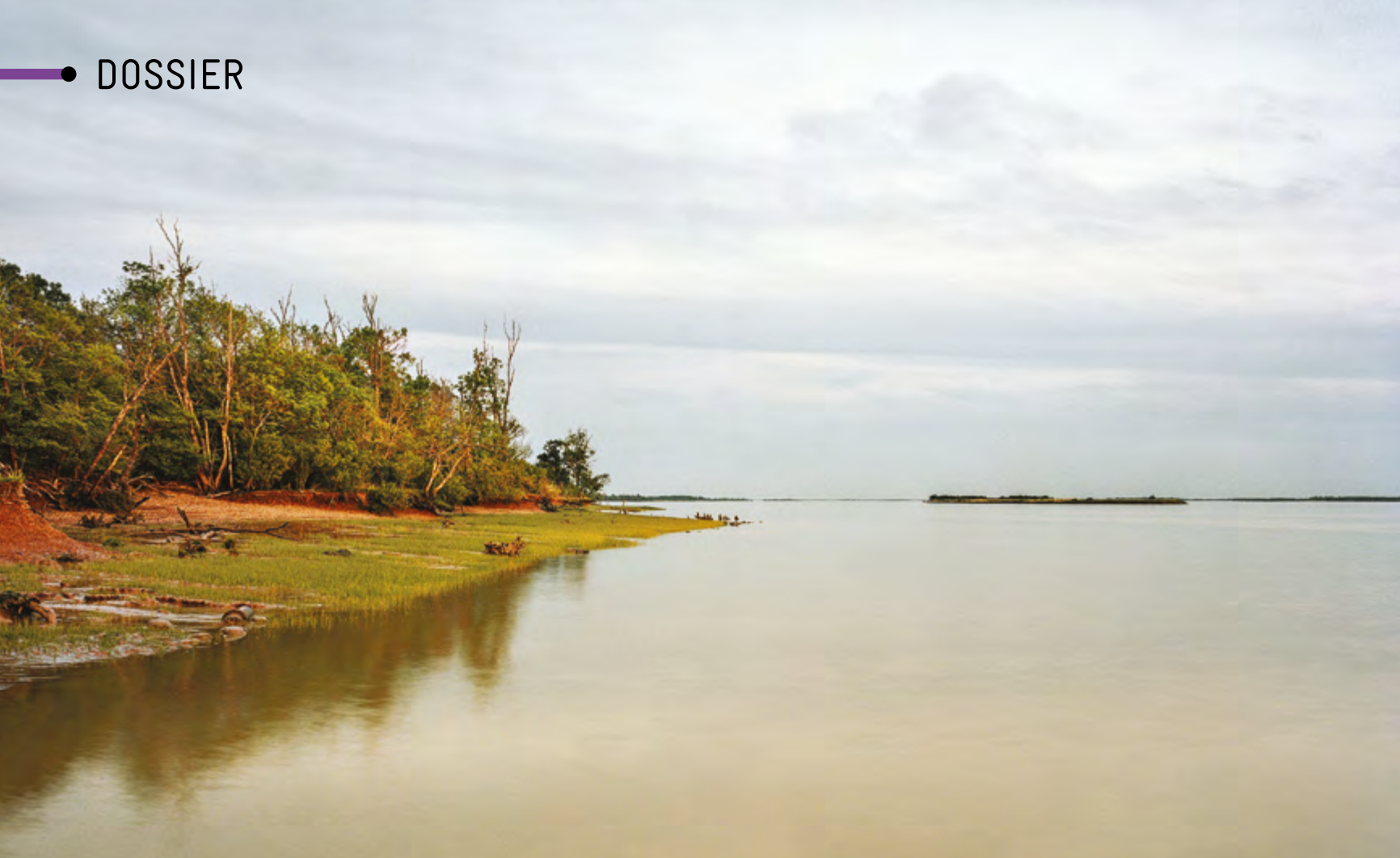
Regards sur la métropole par Maitexu Etcheverria - Voyages insulaires, Île de Patiras