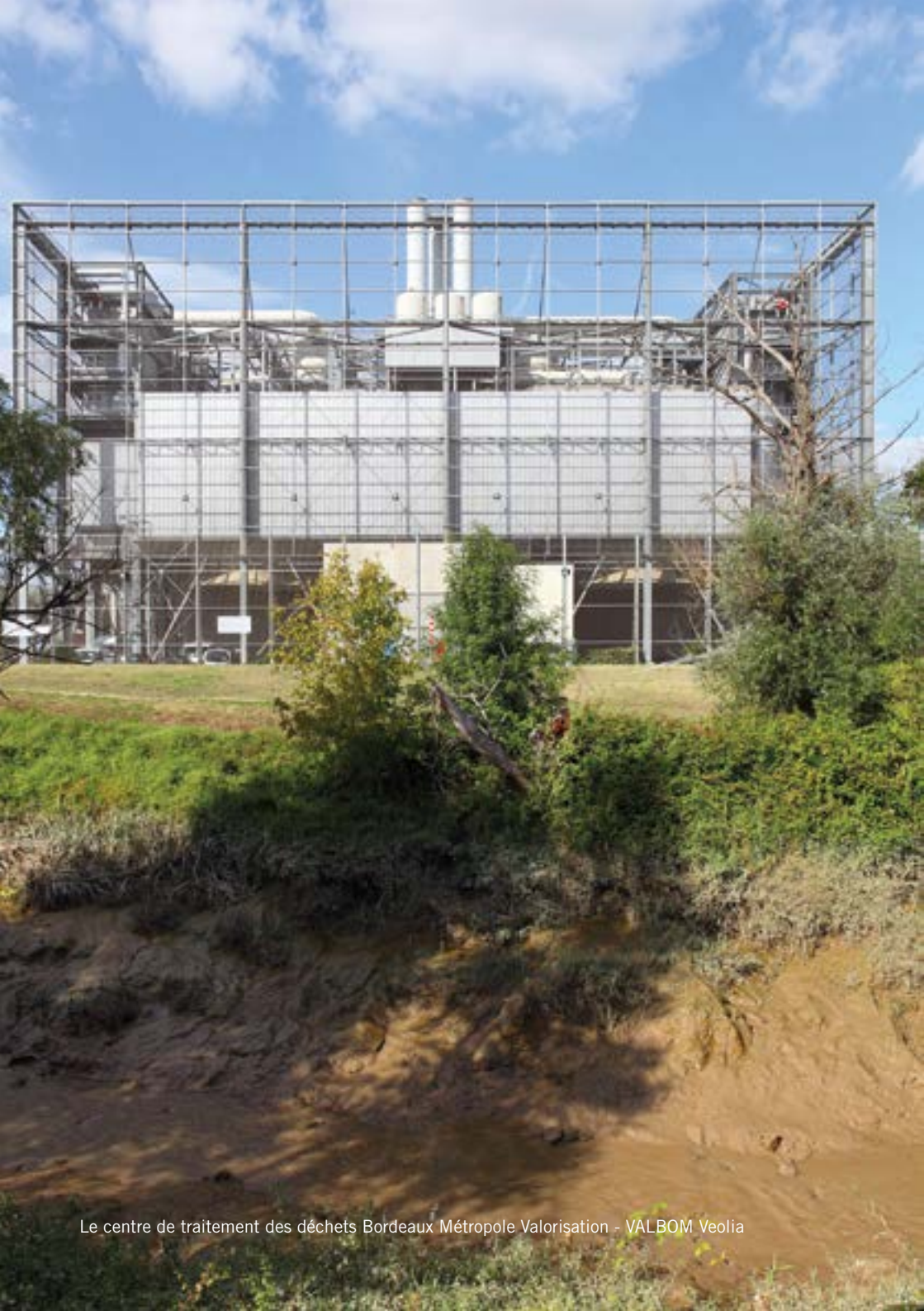
Le centre de traitement des déchets Bordeaux Métropole Valorisation - VALBOM Veolia