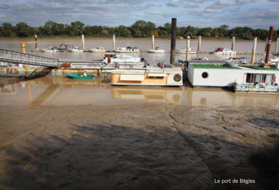
Le port de Bègles

« Je souhaitais dès le départ faire du fleuve Garonne un protagoniste déterminant de mon projet. Son courant, sa couleur, ses marées, ses turbulences devaient constituer l'origine, la matière, l'activateur et pourquoi pas, le personnage principal d'une installation in situ.