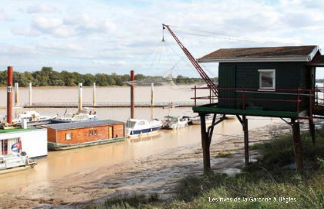
Les rives de la Garonne à Bègles