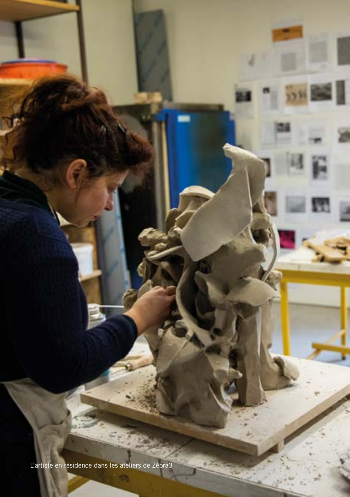
L'artiste en résidence dans les ateliers de Zébra3