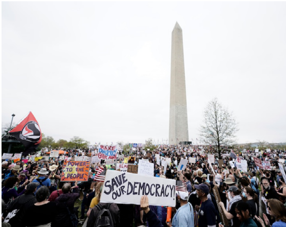
Photo de la manifestation "hands-off" sur la place de Washington Monument