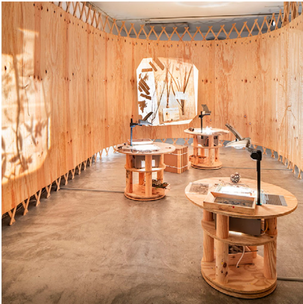
Exposition atelier Les pièces de la Forêt, 2024