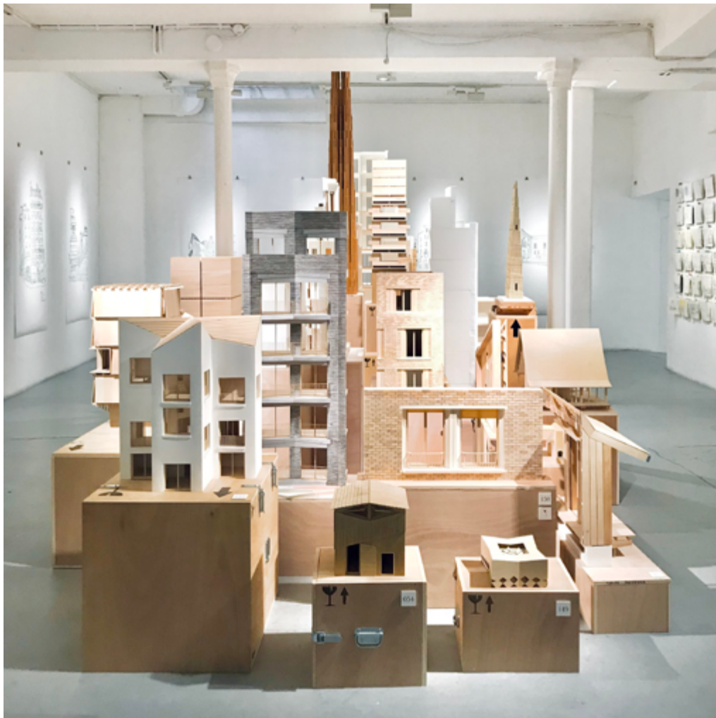
Vue de l'exposition « L'altérité des pièces et la promesse des formes : Jean-Christophe Quinton », à La galerie d'architecture, Paris 4 e , 2024