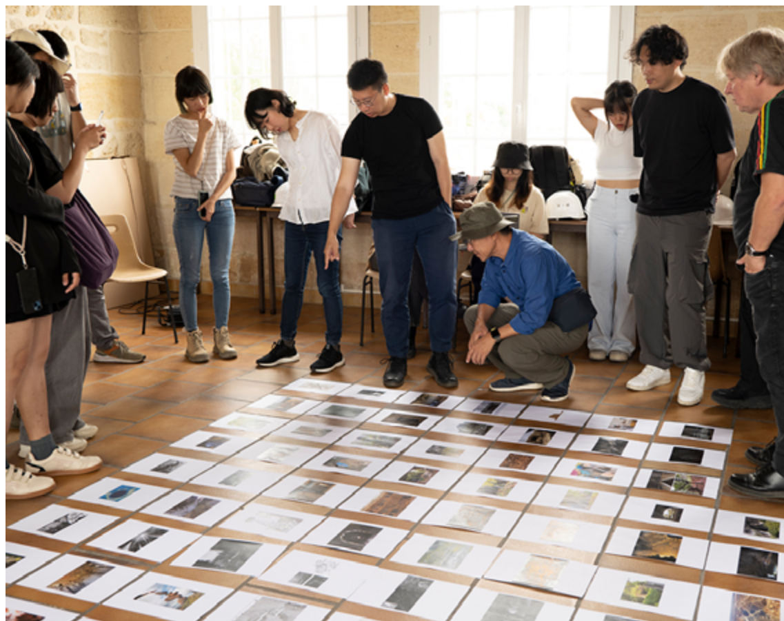
Workshop autour du devenir des carrières de Prignac-et-Marcamps, juillet 2024