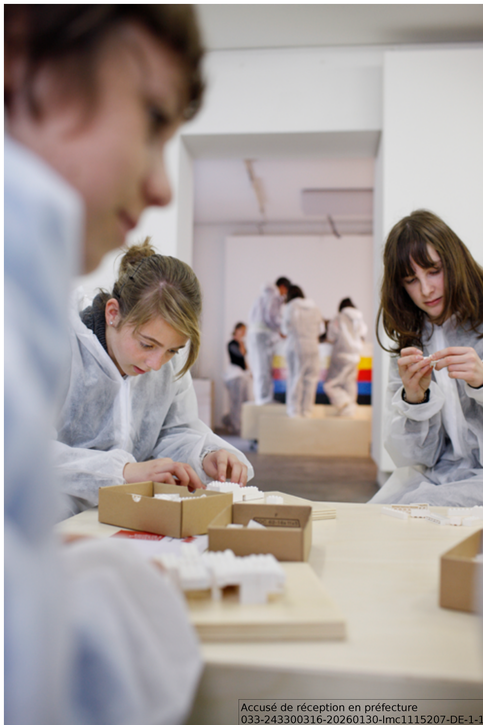
exposition-atelier LEGOPOLITAIN, 2012