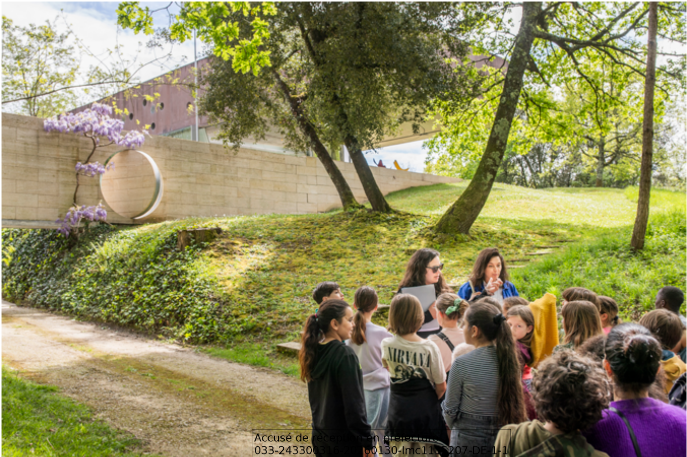
Visite de la maison à Bordeaux, OMA / Rem Koolhaas, Floirac, 2024

Accusé de réception en préfecture 033-243300310 - 0130-Imc111-207-DE-1-1 Date de télétransmission : 06/02/2026 Date de réception préfecture : 06/02/2026 Publié le : 06/02/2026