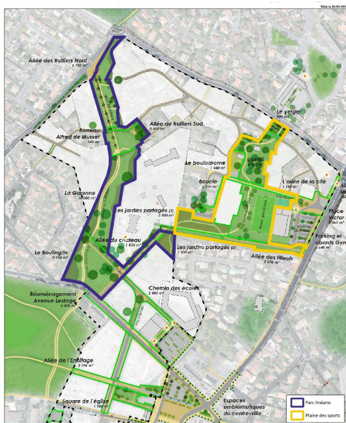
Plan Dossier de réalisation (2018) équipe Alphaville

Aujourd'hui, l'avancement des études de maîtrise d'œuvre urbaine nécessite une modification du projet de programme des équipements publics du dossier de réalisation.