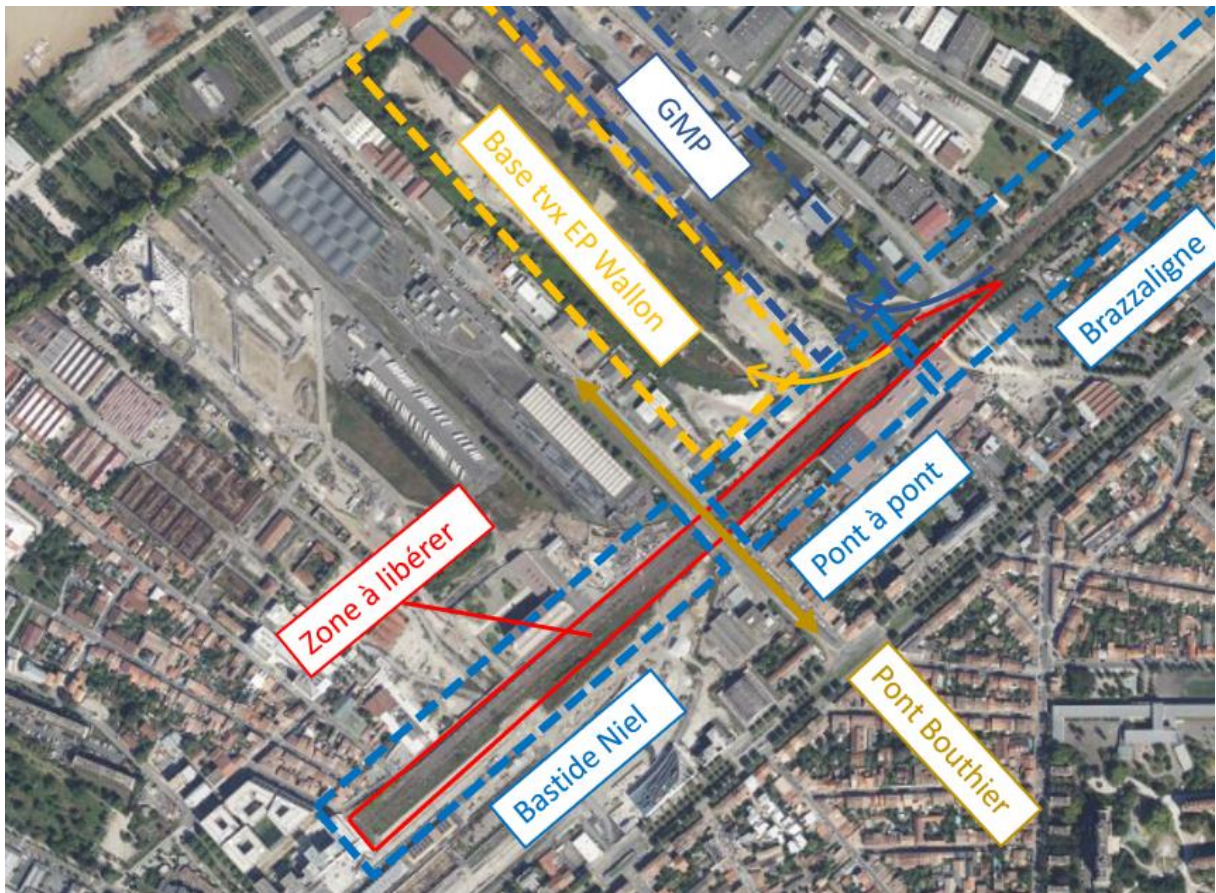
Vue aérienne et schéma des emprises foncières