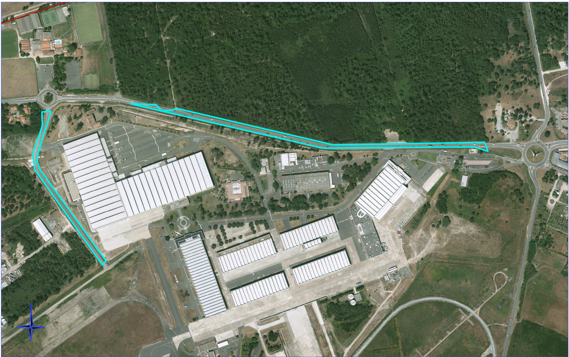
Mérignac - cessions emprises voies à Dassault Aviation