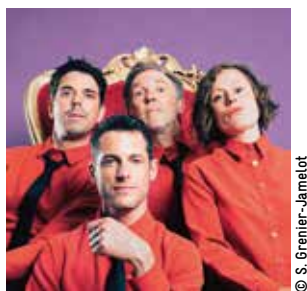
Les gouguettes, en trio mais à quatre.

Les artistes Les gouguettes sont spécialisés dans la caricature et le second degré à travers des chansons française qu'ils revisitent avec aisance. Après 10 années couronnées de succès, ceux qui ont remis l'art des chansonniers sur le devant de la scène, débarquent à l'Espace des 2 Rives d'Ambès, le samedi 14 juin 2025, pour leur tout nouveau spectacle :