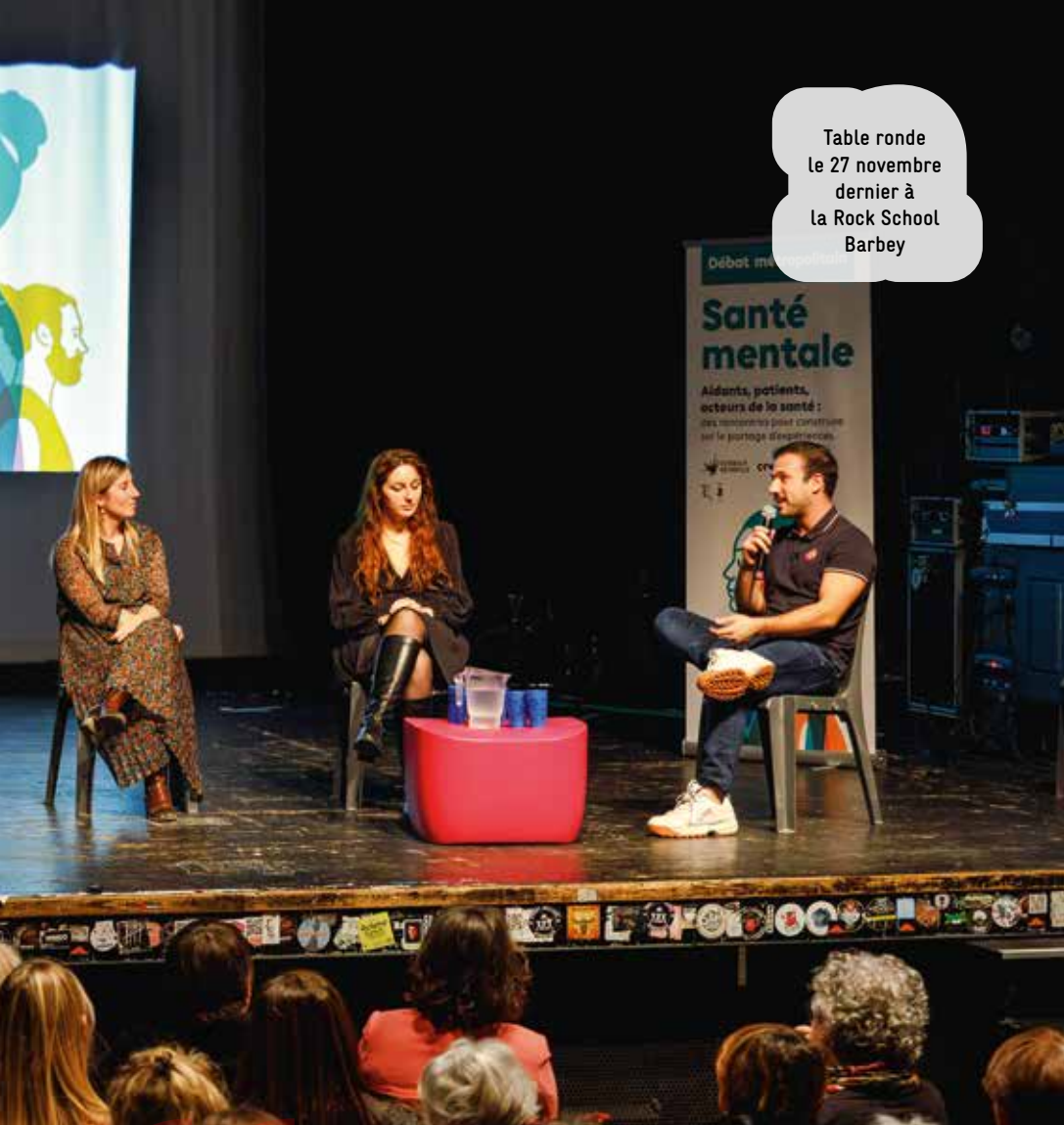
Table ronde le 27 novembre dernier à la Rock School Barbey