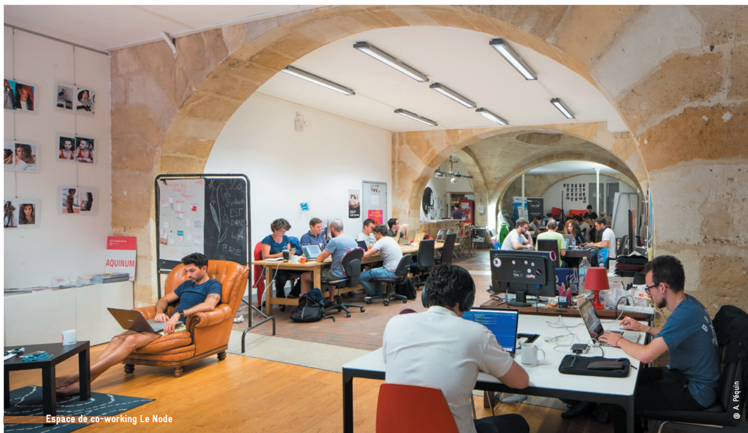
Espace de co-working Le Node

En parallèle, la population a augmenté de 10 000 habitants par an. Le nombre de déplacements est passé par jour, par habitant de 3,8 à 4,2, atteignant 3 millions de déplacements journaliers. Le prix de l'immobilier a cru de 49 % entre 2015 et 2020.