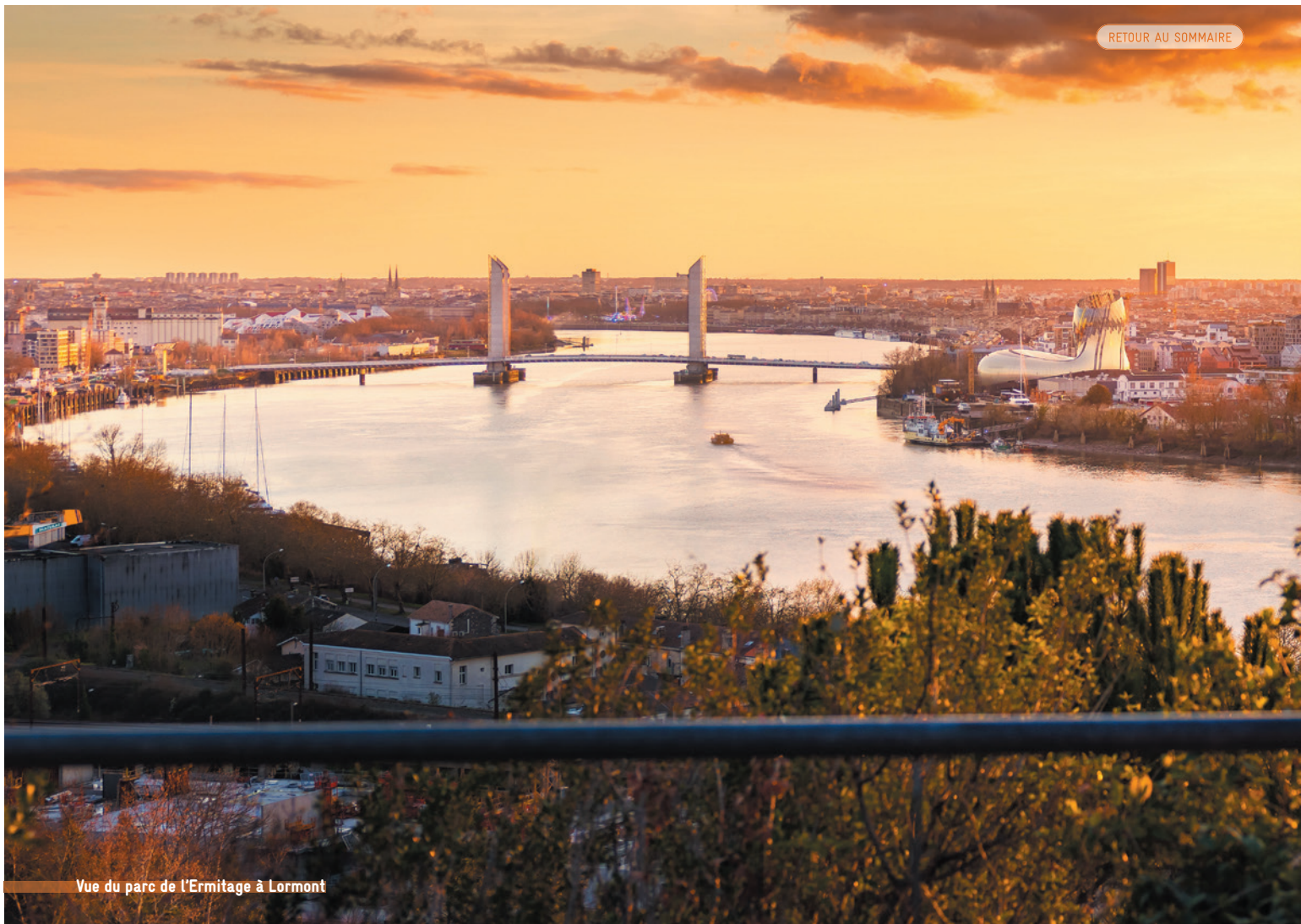
Vue du parc de l'Ermitage à Lormont