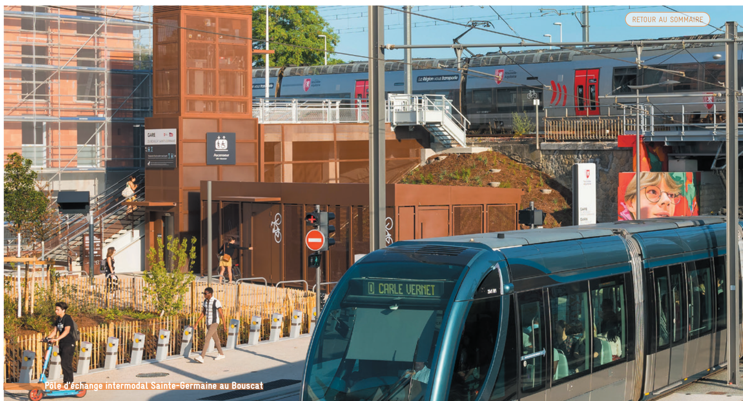
Pôle d'échange intermodal Sainte-Germaine au Bouscat