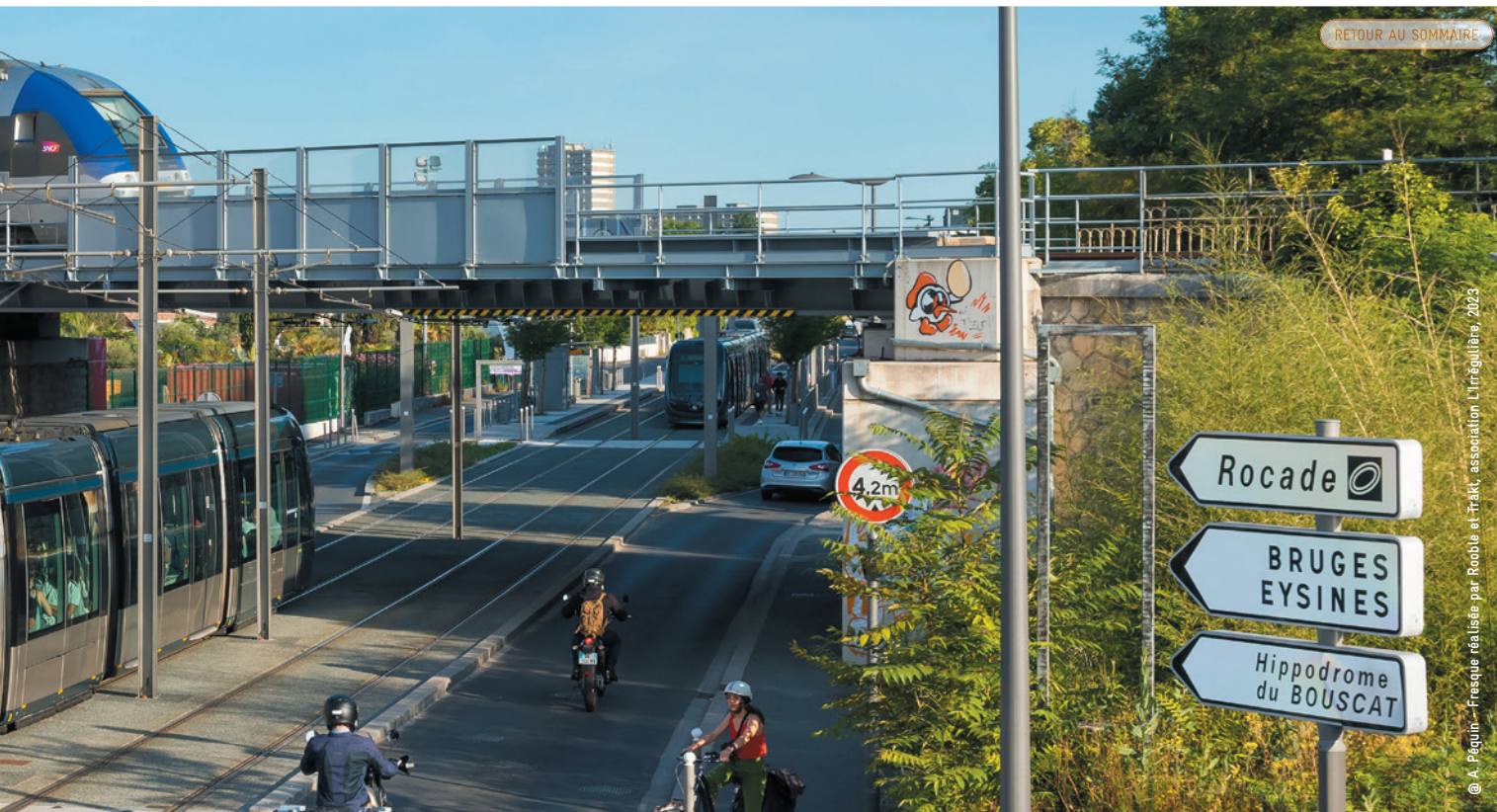
© A. Péguin - Fresque réalisée par Rooble et Trakt, association L'Irrégulière, 2023