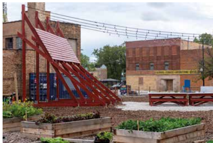
Lieux communs : Micro-interventions à Nove Fuzine. Ljubljana, Slovenie, 2016 Plan Común + Tiago Torres Campos