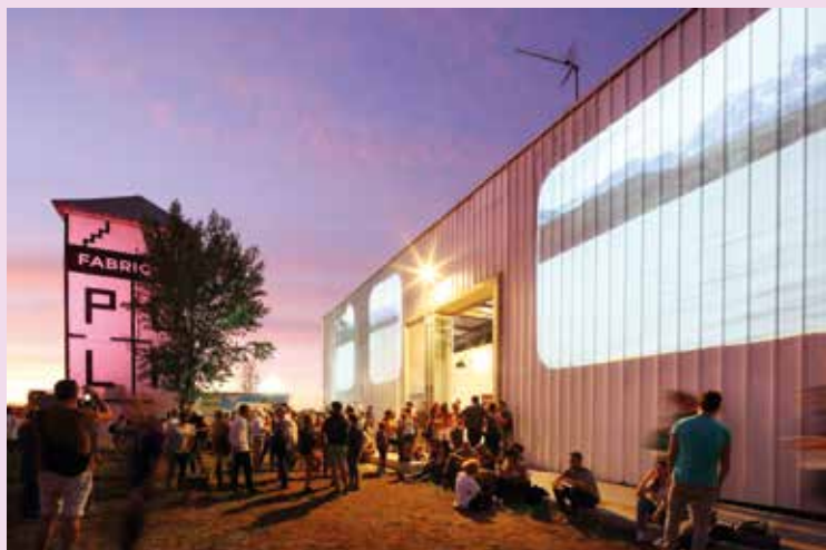
« Nos paysages » installation - Olivier Crouzel - 2019

EN BORD DE GARONNE, UN LIEU-REPÈRE ARTISTIQUE ET CULTUREL EST À DÉCOUVRIR : LA FABRIQUE POLA. OUVERT À TOUS, CET ESPACE DE COOPÉRATION, MARQUEUR DU TERRITOIRE, CONTINUE SON EXPANSION ET SOUFFLERA SES VINGT BOUGIES EN SEPTEMBRE.