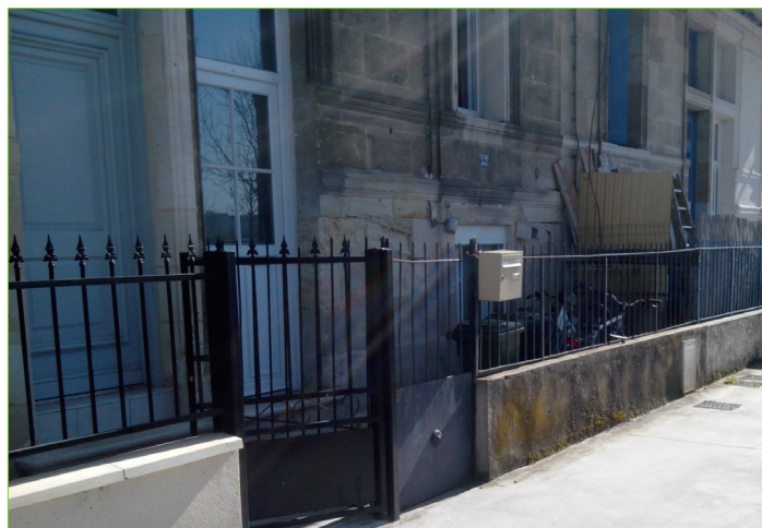
Quai Chaineau Bichon - muret de clôture enduit et grille à barreaudage vertical de couleur sombre