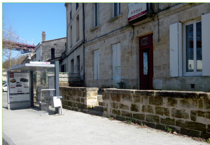
Quai Numa Sensine - muret de clôture en pierre de taille