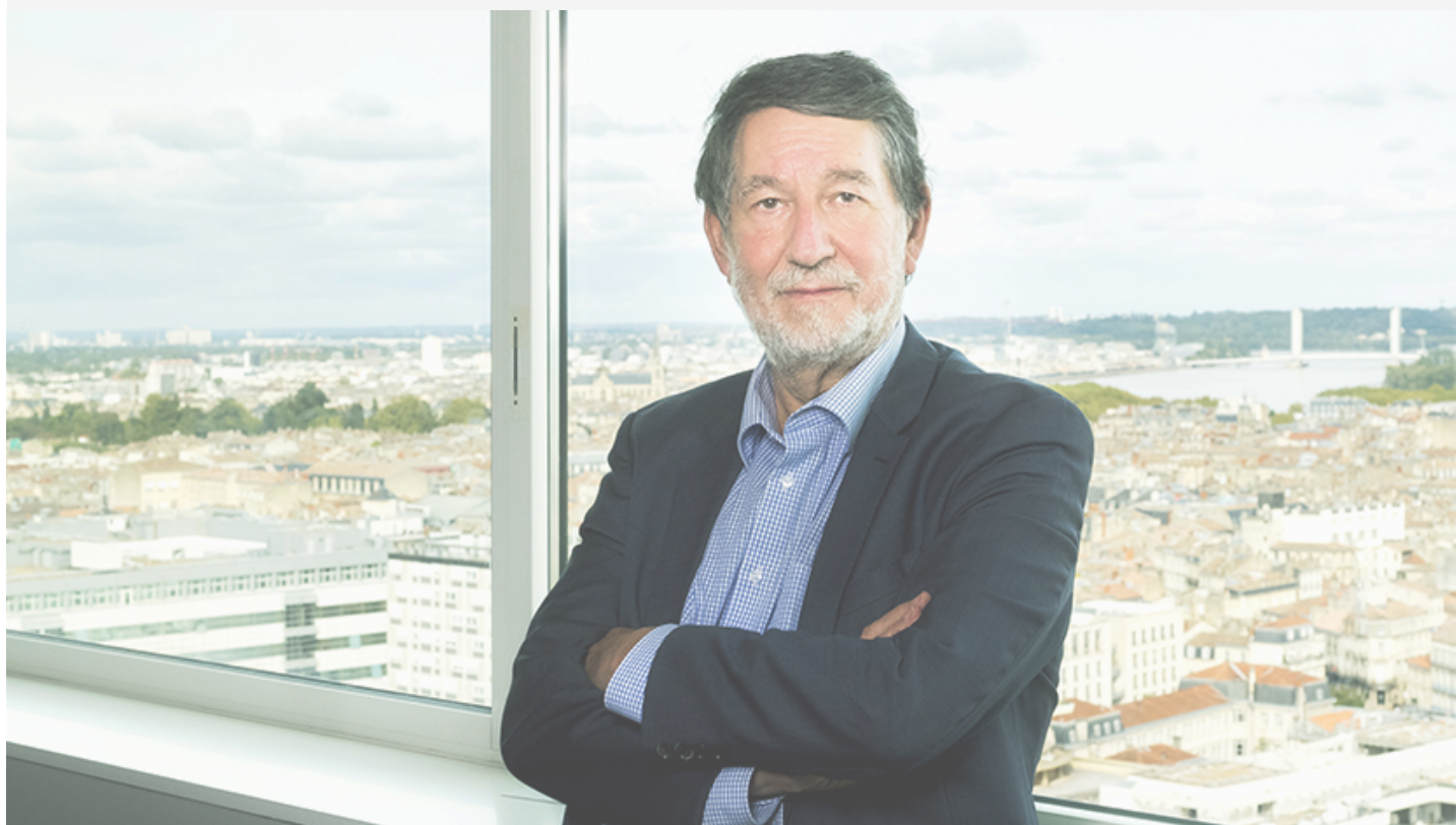
Alain Anziani, Président de Bordeaux Métropole